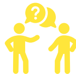
Mise en situation